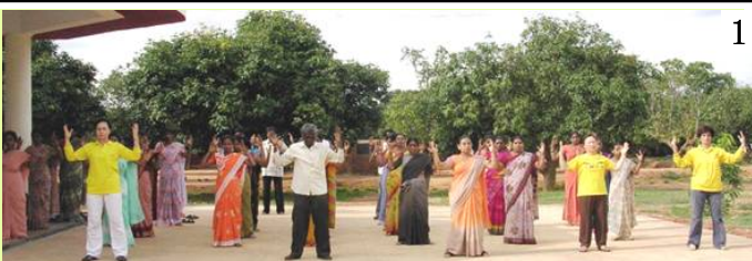
图 1、2/印度学校 Byreshawara 全校师生在体育课上练习法轮功。