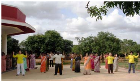
校长和教师们炼功（中间白衣者为校长）