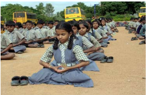
学生们正在操场炼法轮功第五套功法