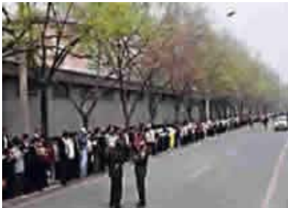
“4.25”事件现场，法轮功学员秩序井然。

个事件，如果没有北京的授权，被逮捕的法轮功群众不会得到释放。天津的公安也向法轮功学员建议：“你们去北京吧，去北京才能解决问题。”