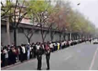
“4.25”事件现场，法轮功学员秩序井然。

个事件，如果没有北京的授权，被逮捕的法轮功群众不会得到释放。天津的公安也向法轮功学员建议：“你们去北京吧，去北京才能解决问题。”