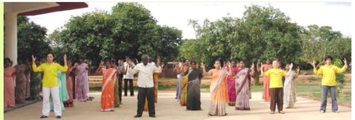
图1、2/印度学校Byreshawara 全校师生在体育课上练习法轮功。