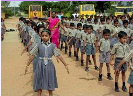
右图：学校学生集体炼法轮功