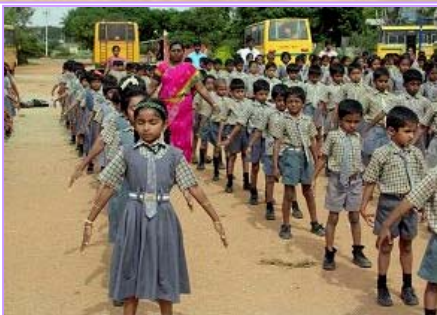
右图：学校学生集体炼法轮功