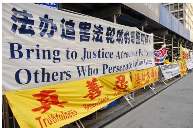
法轮功学员在温家宝下榻的沃道夫旅馆前,呼吁法办迫害法轮功的元凶江泽民、罗干、刘京、周永康

立即制止中国国内还在加剧的对法轮功学员的残酷迫害,法办罪魁祸首江泽民、罗干、刘京、周永康。◇