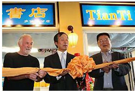
多伦多中区唐人街的“天梯书店”开张