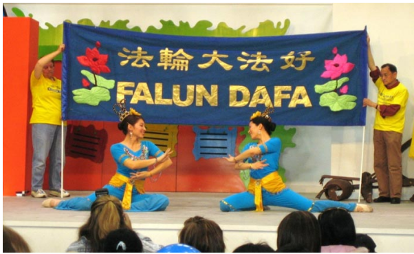
法轮功学员表演舞蹈“花仙”

【明慧网】澳洲昆士兰一年一度规模最为庞大的布里斯本皇家博览会于二零零八年八月登场。昆士兰法轮功学员连续第三年应邀参加了表演。为期十天的博览会是当地居民每年最为期待的盛大活动之一。在人山人海的会馆里，学员们为观众展示了法轮功功法，此外，他们还精心准备了舞狮表演和中华传统舞蹈与澳洲民众分享。