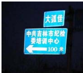
图一：路标牌，写着“大孤佳”

希望善良的正义人士关注此事，一同参与制止对修炼“真善忍”的迫害，善恶有报是天理，也希望那些只看眼前利益的官员和警察立即停止行恶，不要继续作中共的帮凶，否则更大的恶报迟早会降临到你们头上！