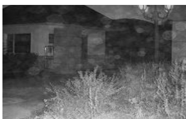
图二：中共吉林市纪检委培训中心——邪恶洗脑基地