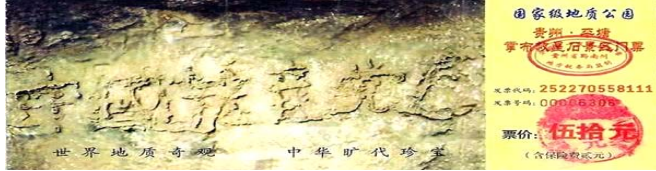
图为藏字石风景区门票：“中国共产党亡”清晰可见

2002年6月，在贵州省平塘县发现了巨石的断裂面上凸现出“中国共产党亡”六个大字，被称为“藏字石”。经专家鉴定该巨石是二亿七千万年前生成、五百年前从山上滚下裂开的，系天然形成。可见上天早已注定了中共走向灭亡的命运！