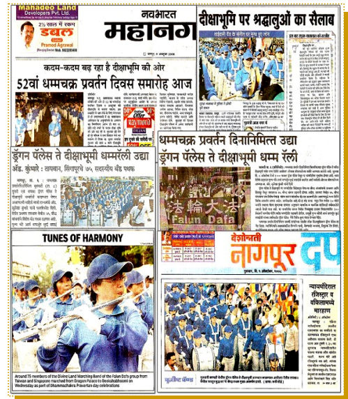
印度各大报纸报道天国乐团和法轮功