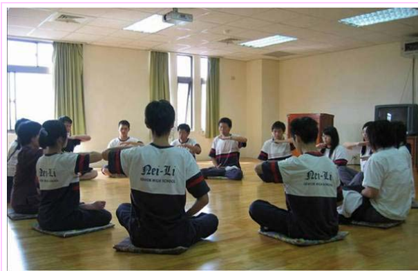
学生一起利用午休时间炼功

【明慧网】法轮功在台湾的校园广泛传播，“真善忍”的种子悄然开花，在有缘接触法轮大法的学生与教师的身上，你会发现生命的希望、教育的方