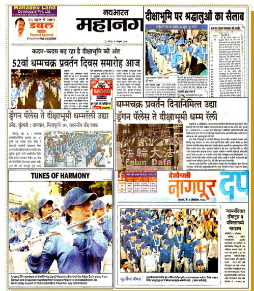
印度各大报纸报道天国乐团和法轮功