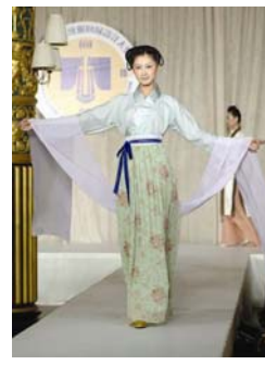
参 赛 作 品