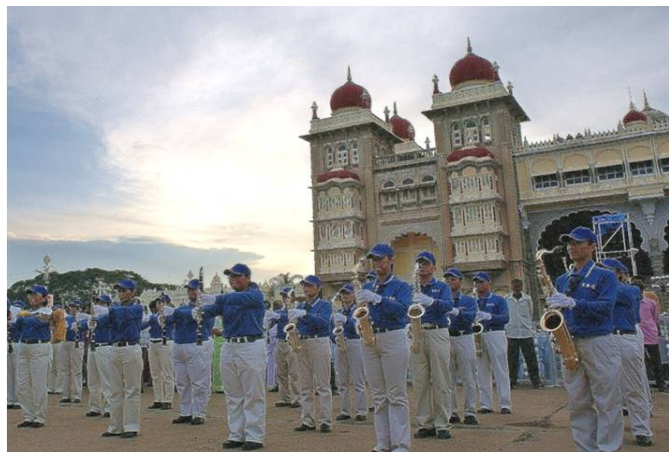
亚太天国乐团在迈索尔王宫前表演

二零零八年十月七日，法轮大法亚太天国乐团首次受邀到印度迈索尔城市（Mysore），为每年一度的重要节庆达瑟拉节（Dasara）演奏，顿时成为焦点。乐团不但吸引多家媒体争相报导，同时也现场直播到全国各地。印度政府的国防部长也亲临现场与迈索尔市长一起观看天国乐团的演出。