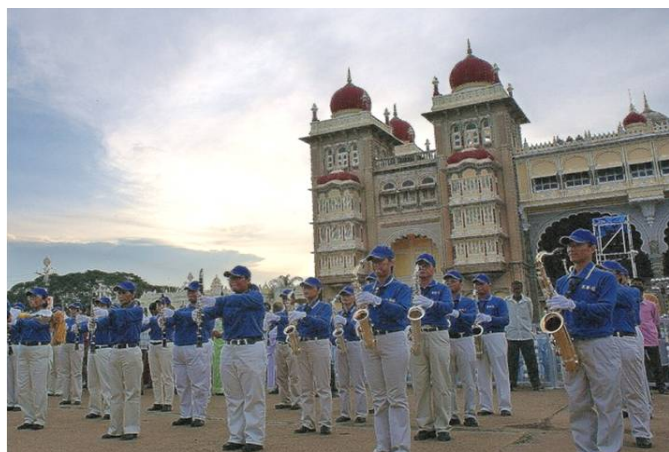
亚太天国乐团在迈索尔王宫前表演

二零零八年十月七日，法轮大法亚太天国乐团首次受邀到印度迈索尔城市（Mysore），为每年一度的重要节庆达瑟拉节（Dasara）演奏，顿时成为焦点。乐团不但吸引多家媒体争相报导，同时也现场直播到全国各地。印度政府的国防部长也亲临现场与迈索尔市长一起观看天国乐团的演出。