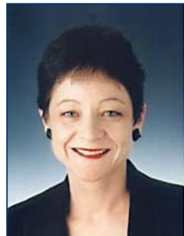
欧洲议会人权委员会副主席，英国女勋爵莎拉·拉德福德女士

近期，欧洲议会人权委员会副主席、英国女勋爵莎拉·拉德福德女士在接受专访时表示，让她吃惊的不是中共的行为，而是欧洲公司在自己的家乡享受言论自由的同时，却对独裁政府卑躬屈膝，欧洲卫星公司不应该与中共串通合谋。◇