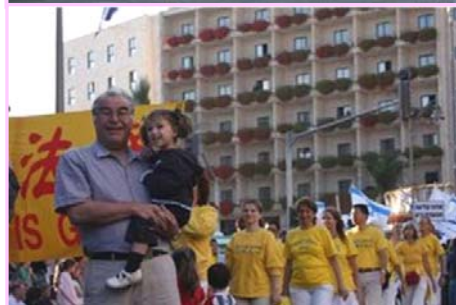
上：世界需要真善忍