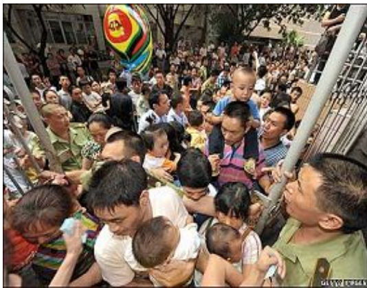
在四川成都一家医院门前挤满了带孩子的家长。

评论说，这个帖子的题目貌似调侃：《中国人在食品中完成了化学扫盲》，然而这却是令人悲愤的事实，据网民统计，近 10 年来被公开报道的人为污染的食品，至少有 60 种之多，象“洗衣粉猪肉”、“避孕药甲鱼”等等不一而足。因辉煌的奥运会而沉醉的中国民众，一夜之间开始为自己身体里究竟