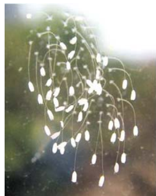
青岛某公司玻璃上开出的优昙婆罗花

2008年10月4日，新华网罕见的转载了《青岛日报》的一篇报道，题目是《窗户玻璃长出“花”》。