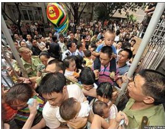
在四川成都一家医院门前挤满了带孩子的家长。

评论说，这个帖子的题目貌似调侃：《中国人在食品中完成了化学扫盲》，然而这却是令人悲愤的事实，据网民统计，近 10 年来被公开报道的人为污染的食品，至少有 60 种之多，象“洗衣粉猪肉”、“避孕药甲鱼”等等不一而足。因辉煌的奥运会而沉醉的中国民众，一夜之间开始为自己身体里究竟