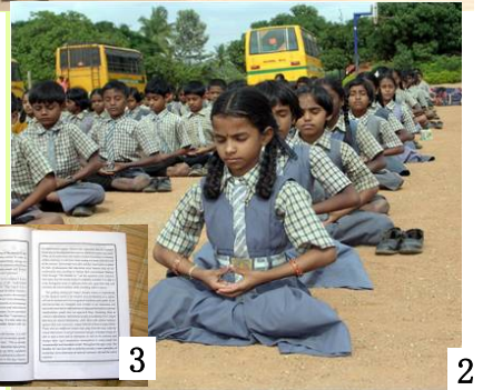
图 3/Byreshawara 学校还将《转法轮》中的《论语》引入英文教材。