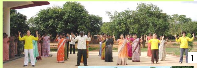
图 1、2/印度学校 Byreshawara 全校师生在体育课上练习法轮功。