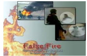
揭露自焚的影片《伪火》获第51届哥伦布国际电影节荣誉奖。