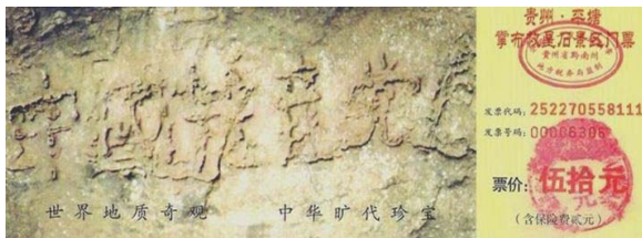
平塘县掌布乡“藏字石”风景区门票

在贵州省平塘县掌布乡发现了一块带字的巨石，字为“中国共产党亡”。巨石距今2.6亿年，重200多吨，字出现在500年前崩裂的断面上。每个字高25厘米。经三批国内专家鉴定，字是天然形成。现已被作为旅游景点，下图为景点门票照片。