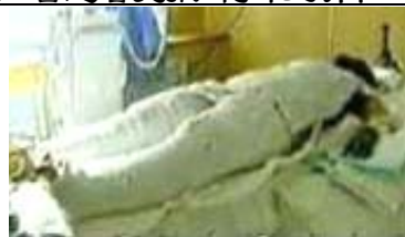
央视《焦点访谈》录像中的“自焚者”被包裹十分严密

现在，法轮大法的光辉已洒遍全世界八十多个国家。截止二零零八年三月，获得海外各国政府及各界的褒奖与支持议案信函有 2945 项。法轮大法主要著作《转法轮》等被翻译成 30 种语言并在世界各地出版发行；还有更多语种的翻译正在进行过程之中；李洪志先生从二零零零年起连