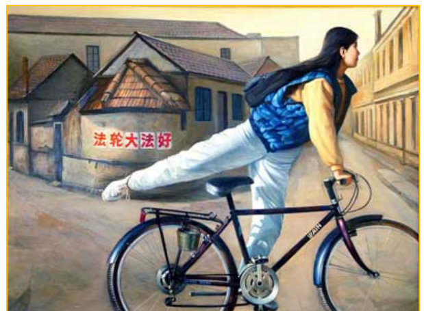
△油画《信使》(作者/董锡强)

跨越千山万水，我一次又一次为您而来，可贵的有缘人啊，您是否听到全世界都在说：法轮大法好！真善忍好！请您了解真相，切莫错过这万古的机缘