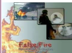
揭露自焚的影片《伪火》获第51届哥伦布国际电影节荣誉奖。

年，安徽省爆发“大头婴”惨剧时，三鹿奶粉就被列入“阜阳市抽检不合格奶粉名单”，被各地商家撤下货架。但三鹿集团通过向上公关，最后由中共河北省当局亲自出面“澄清”，让三鹿奶粉恢复正常销售。