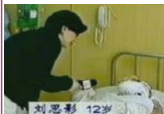
气管切开后能唱歌