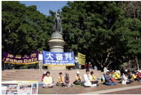
澳洲纽省高等法院前女皇广场

【明慧网】二零零八年九月十五日，澳洲法轮功学员状告迫害法轮功元凶江泽民、罗干及 610 办公室一案在纽省高等法院开庭。