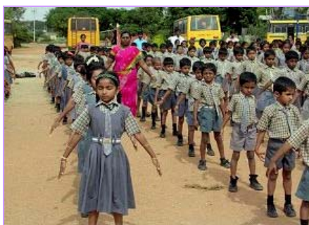
右图:学校学生集体炼法轮功