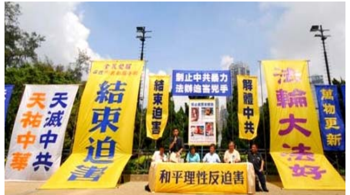
香港法轮功学员举行“制止中共暴力，法办迫害凶手”集会大游行

针对中共当局蓄意制造攻击及诬陷事件，以及港府屈从中共加剧打压法轮功的情况，二零零八年九月二十日，香港法轮功学员举行“制止中共暴力，法办迫害凶手”集会大游行，抗议中共当局在香港炮制针对法轮功的暴力袭击与诬蔑构陷，并呼吁社会各界伸张正义，制止中共当局对法轮功的迫害，将迫害元凶及幕后操纵者绳之于法。