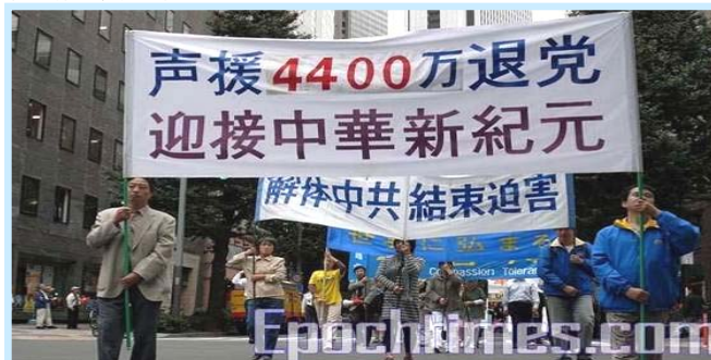
2008 年 10 月 19 日，日本东京民众声援退党潮

《九评共产党》一书深刻揭露了中共邪恶本质，已在中国促成强大的退出中共恶党的大潮，到 2008 年 10 月 31 日已有超过 4479 万中国民众在海外大纪元网站声明退出中共党、团、队。其中包括中共党军高层内的党员。