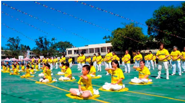
■ 法轮功学员整齐划一样的功法演示

二零零八年十月十八日秋高气爽，台湾桃园县龙潭乡石门国小九十周年的校庆庆典上，法轮