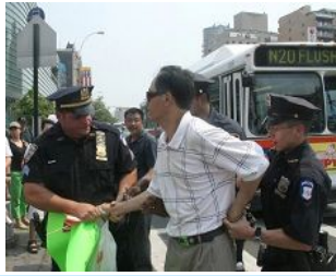
美国警察逮捕谩骂法轮功学员的中共暴徒。

美国 【明慧网】零八年五至六月，在中共政法委书记周永康的策划下，中共从国内到海外配合式构陷法轮功，继续制造谎言煽动中国民众和海外华人对法轮功的仇恨。在中领馆的幕后组织下，五月十七日，暴徒大规模骚扰和围攻纽约退党服务中心，并殴打退党服务中心员工。并在此后数日，在法拉盛的“九评”资料点连续发生严重恶性围攻和威胁工作人员的事件。之后中共新华网和央视国际将此事件谎编成“纽约华人为四川震灾募捐，法轮功现场捣乱”，公开对十三亿中国人撒谎和行骗，妄想煽动民众的仇恨。