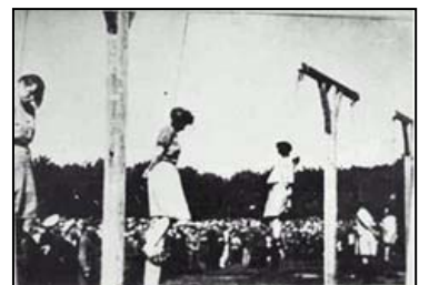
[照片：纽伦堡国际战犯法庭经过对纳粹集中营死亡护士组在对犹太人的种族灭绝中所犯罪行的认定，于 1946 年对她们执行死刑。]

联想到现在有些执法、犯法人员在迫害法轮功学员时想的或说的一句托词：“执行上级命令”或“为了工作”等。显得多么苍白无力和没有法律依据。退一步讲，你也找不到上级下命令的证据，因为卑鄙、狡猾、心虚的上级只是口头传达，不给你留下下达违法命令的证据，他就怕给你留下文字证据。试问你有这样的证据吗？而你的犯罪行为可是谁都