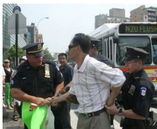
美国警察逮捕谩骂法轮功学员的中共暴徒。

美国 【明慧网】零八年五至六月，在中共政法委书记周永康的策划下，中共从国内到海外配合式构陷法轮功，继续制造谎言煽动中国民众和海外华人对法轮功的仇恨。在中领馆的幕后组织下，五月十七日，暴徒大规模骚扰和围攻纽约退党服务中心，并殴打退党服务中心员工。并在此后数日，在法拉盛的“九评”资料点连续发生严重恶性围攻和威胁工作人员的事件。之后中共新华网和央视国际将此事件谎编成“纽约华人为四川震灾募捐，法轮功现场捣乱”，公开对十三亿中国人撒谎和行骗，妄想煽动民众的仇恨。