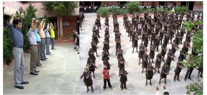
JYOTHISCHOOL 学校学生集体炼功，老师在前排示范

【明慧网二零零八年十月一日】（台湾法轮大法学员吴树枝报道）二零零八年八月十五日，带着曾经对热心推广法轮功的印度学校校长及学员的承诺及期待，我们三度搭机前往印度邦加罗尔（Bangalore）。