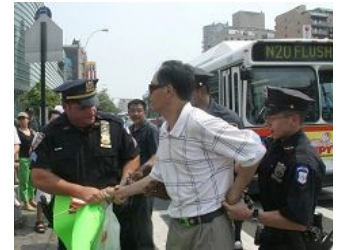
美国警察逮捕谩骂法轮功学员的中共暴徒。

美国 零八年五至六月，在中共政法委书记周永康的策划下，中共从国内到海外配合式构陷法轮功，继续制造谎言煽动中国民众和海外华人对法轮功的仇恨。在中领馆的幕后组织下，五月十七日，暴徒大规模骚扰和围攻纽约退党服务中心，并殴打退党服务中心员工。并在此后数日，在法拉盛的“九评”资料点连续发生严重恶性围攻和威胁工作人员的事件。之后中共新华网和央视国际将此事件谎编成“纽约华人为四川震灾募捐，法轮功现场捣乱”，公开对十三亿中国人撒谎和行骗，妄想煽动民众的仇恨。