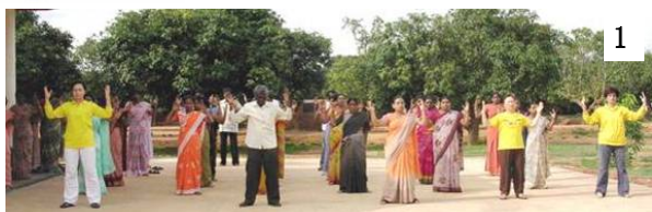
图 12/Byreshawara 学校全校师生在体育课上练习法轮功。