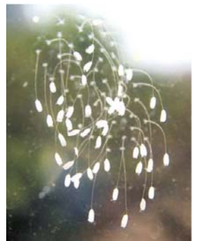
青岛某公司玻璃上开出的优昙婆罗花

2008 年 10 月 4 日，新华网罕见的转载了《青岛日报》的一篇报道，题目是《窗户玻璃长出“花”》。文中说，10 月 3 日上午，青岛早报记者来到城阳大北曲西村的一家企业，在公司二楼办公室东侧的玻璃上看到了这些白