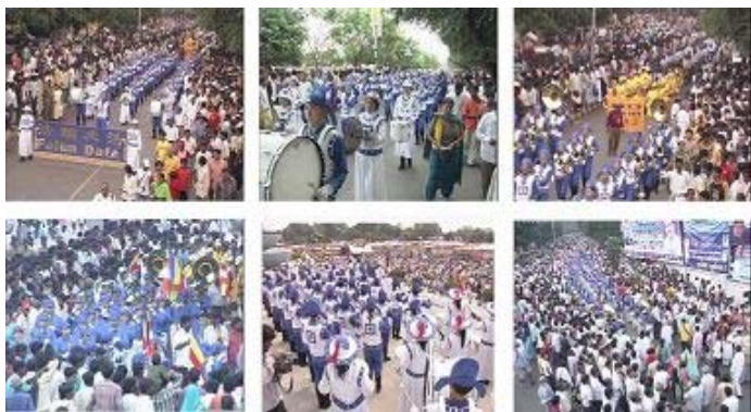
▲天国乐团十月七日至十日在印度演出,受到民众热烈欢迎

【明慧网】二零零八年十月七日，由台湾、马来西亚和新加坡法轮功学员所组成的亚太天国乐团