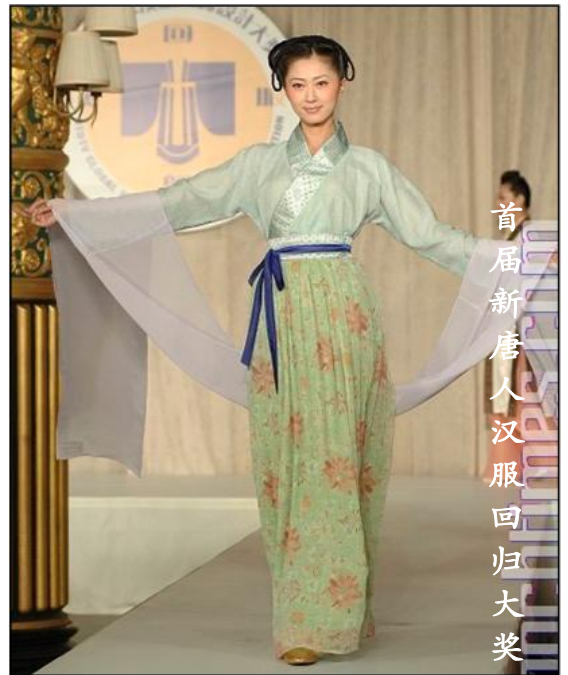
首届新唐人汉服回归大奖