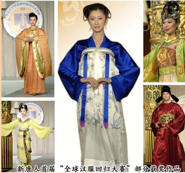
新唐人首届“全球汉服回归大赛”部分获奖作品

二零零八年十月十九日，首届新唐人汉服回归大奖赛在世界时装之都的曼哈顿乔治王子宴会厅圆满落幕。大赛吸引了世界上百位设计师，收到设计图一千多幅，其中六十多位设计师的二百五十套作品图入围决赛，五十二套服装由时装模特儿展