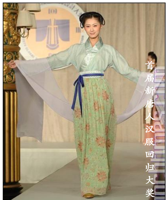
首届新唐人汉服回归大奖