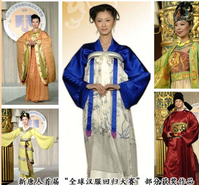
新唐人首届“全球汉服回归大赛”部分获奖作品

二零零八年十月十九日，首届新唐人汉服回归大奖赛在世界时装之都的曼哈顿乔治王子宴会厅圆满落幕。大赛吸引了世界上百位设计师，收到设计图一千多幅，其中六十多位设计师的二百五十套作品图入围决赛，五十二套服装由时装模特儿展