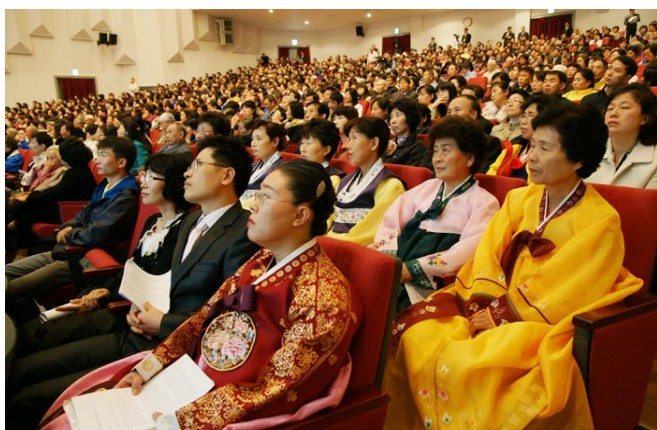
法会上法轮功学员聆听学员心得交流