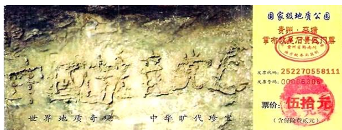
贵州省平塘县掌布乡风景区门票

一提到“天灭中共、三退保命”，有的朋友就说这是“搞政治”。但如果要查查“天灭中共”这个说法的来源，却发现居然是上天点拨石头“实话石说”。