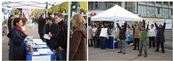
学员向人们讲述迫害真相

【明慧网二零零八年十一月十日】二零零八年十一月八日，德国法轮功学员在汉诺威市中心克吕佩克广场讲真相，揭露中共活摘法轮功学员器官的罪行，呼吁民众共同制止迫害。周六的吕佩克广场，逛街购物的人熙熙攘攘，法轮功摊位旁常常站满了人驻足观看。当看到法轮功学员被中共活摘器官的图片展览时，许多人非常震惊和愤怒。到摊位前签名声援法轮功的人络绎不绝。许多人签完名字后向法轮功学员询问迫害的详情。民众纷纷表示支持法轮功。