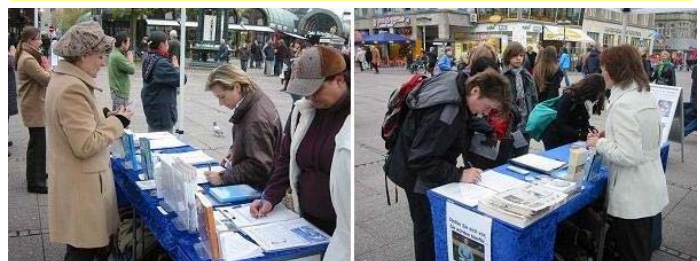
路人签名声援法轮功