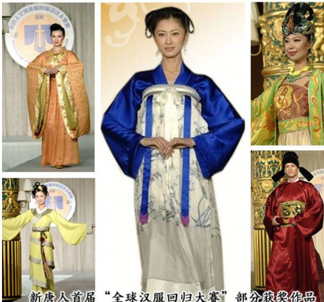
新唐人首届“全球汉服回归大赛”部分获奖作品

二零零八年十月十九日，首届新唐人汉服回归大奖赛在世界时装之都的曼哈顿乔治王子宴会厅圆满落下帷幕。大赛吸引了世界上百位设计师，收到设计图一千多幅，其中六十多位设计师的二百五十套作品图入围决赛，五十二套服装由时装