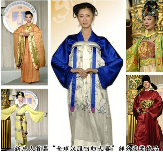
新唐人首届“全球汉服回归大赛”部分获奖作品

二零零八年十月十九日，首届新唐人汉服回归大奖赛在世界时装之都的曼哈顿乔治王子宴会厅圆满落下帷幕。大赛吸引了世界上百位设计师，收到设计图一千多幅，其中六十多位设计师的二百五十套作品图入围决赛，五十二套服装由时装