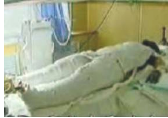
央视中的“自焚者” 被包裹得严密。