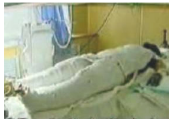
央视中的“自焚者” 被包裹得严密。