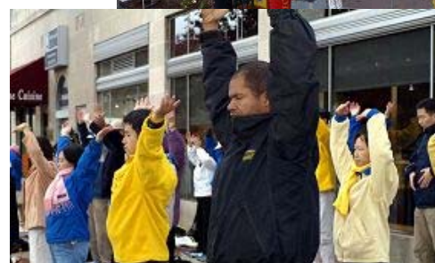
（上图）大华府地区部份法轮功学员在胡入住的酒店外抗议迫害。