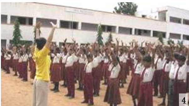
印度八十多年 图 1、2: Byreshawara 学校师生在体育课上炼法轮功。图 3: 学校将法轮功经文《论语》引入英文教材。图 4: JYOTH 学校。

邦加罗尔是印度炼法轮功人数最多的地区，仅在教育界就有八十多个学校的师生在炼。师生炼功后健康得到改善，学生功课普遍进步。