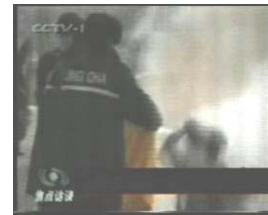
3、手摸被打后的头部