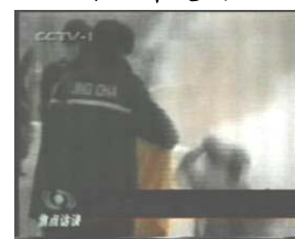
3、手摸被打后的头部