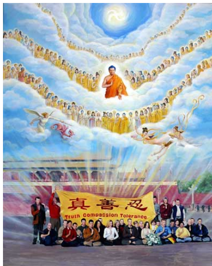
作者：周怡秀、陈肖平 油彩：51in×64in

1999年7月20日，中共邪党开始镇压法轮功，为了达到镇压的目的，中共动用一切宣传工具，造谣、诬陷、诋毁法轮功，从此大批的大法弟子为了说明真相，不畏强暴，纷纷走上北京天安门，“法轮大法好！”的呼声响彻寰宇。