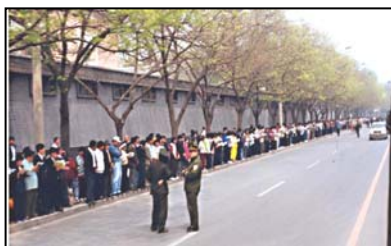
安静祥和的上访现场

法轮功学员在上访过程中，既无游行示威，也无标语口号，也没有影响交通和民众生活，平静离开后地上无一片纸屑，甚至连警察扔下的烟头都被他们清扫一净。当时现场的警察就感慨的说：“看，这就是德！”如此文明理性的上访请愿在世界上可能也绝无仅有。这算什么“围攻”？