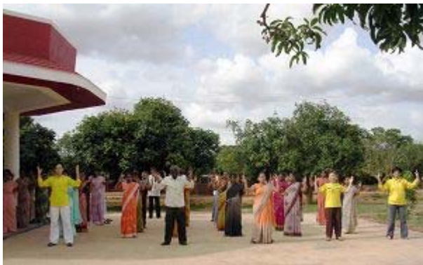
校长及老师集体炼功