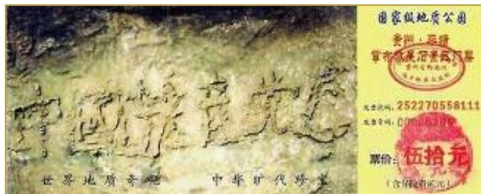
▲贵州省平塘县掌布乡藏字石风景区门票

一提到“天灭中共、三退保命”，有的朋友就说是“搞政治”。但如果查查“天灭中共”说法的来源，却发现居然是上天点拨石头“ 实话石说 ”。零二年六月，贵州省平塘县掌布乡发现了距今 2.7 亿年的藏字石，自然形成的巨石断面上，惊现“ 中国共产党亡 ”六个大字。