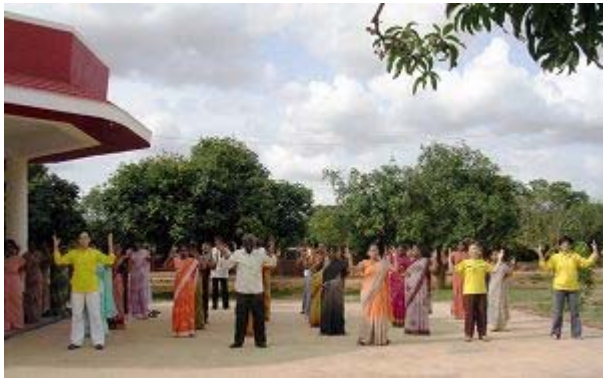
校长及老师集体炼功