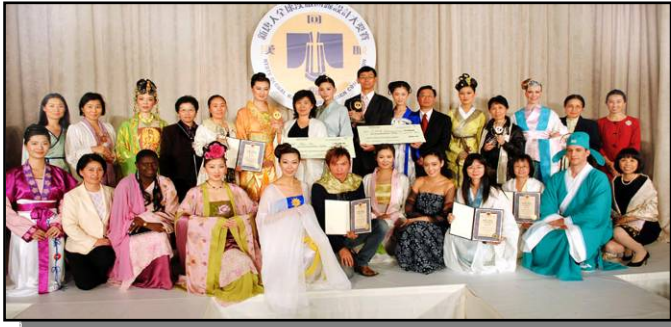
图为各国参赛选手合影留念

【明慧网】二零零八年十月十九日，首届由法轮功学员主办的新唐人汉服回归大奖赛在世界时装之都的曼哈顿乔治王子宴会厅圆满落下帷幕。大赛吸引了来自世界九个国家和地区的上百位设计师的一千多幅设计图，其中六十多位设计师的二百五十套作品图入围决赛，五十二套服装由时装模特儿展示参加了决赛表演。王子宴会厅内，一套套汉