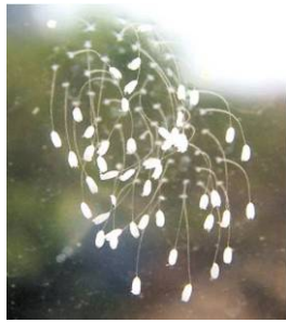
青岛某公司玻璃上开出的优昙婆罗花

企业，在公司二楼办公室东侧的玻璃上看到了这些白色小花。雪白的花朵直径约有 1 毫米，花形如钟，淡白色，花茎细如金丝，共有 47 朵。仔细看，47 朵小花的花径与玻璃直接连在一起，既没有扎根泥土，玻璃下面也没有裂痕。公司员工说，刚开始发现这些小花时，不知道是什么东西，还以为玻璃不干净，差点用抹布擦掉。公司一名经理看过后说，这可能是传说中的『优昙婆罗花』。