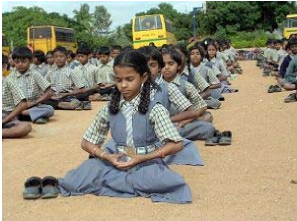
Byreshawara 学校学生集体炼法轮功