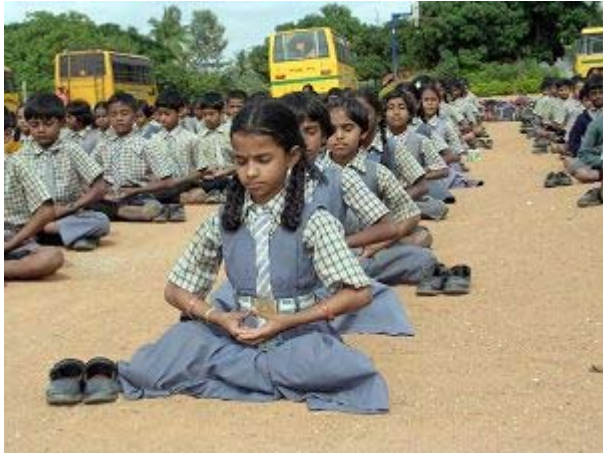
Byreshawara 学校学生集体炼法轮功