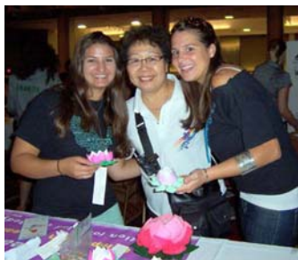
■ 莲花象征着法轮功学员坚贞不屈的精神，深受学生们的喜爱。上图为学会了叠纸莲花的学生同法轮功学员合影。