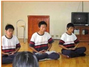
劲炫（中）利用午休时间和同学一起炼功

之后历史老师教我学炼法轮功，我利用每天中午半小时和其他同学一起到学校行政大楼的五楼辅导