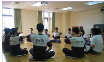
学生一起利用午休时间炼功

【明慧网】法轮功在台湾的校园洪传，“真善忍”的种子悄然开花，在有缘接触法轮大法的学生与教师的身上，你会发现生命的希望、教育的方向。