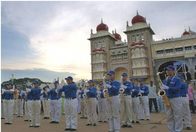
亚太天国乐团在迈索尔王宫前表演

二零零八年十月七日，法轮大法亚太天国乐团首次受邀到印度迈索尔城市（Mysore），为每年一度的重要节庆达瑟拉节（Dasara）演奏，顿时成为焦点。乐团不但吸引多家媒体争相报导，同时也现场直播到全国各地。印度政府的国防部长也亲临现场与迈索尔市长一起观看天国乐团的演出。