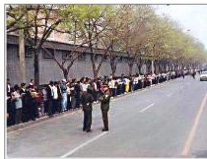
上访学员安静祥和，警察没事闲聊天