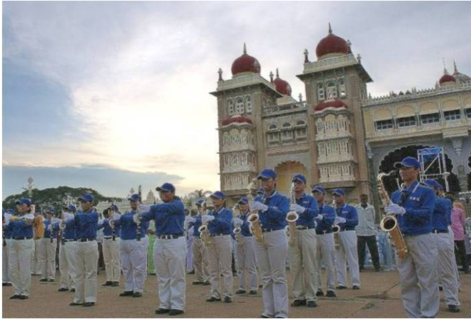
亚太天国乐团在迈索尔王宫前表演

二零零八年十月七日，法轮大法亚太天国乐团首次受邀到印度迈索尔城市（Mysore），为每年一度的重要节庆达瑟拉节（Dasara）演奏，顿时成为焦点。乐团不但吸引多家媒体争相报导，同时也现场直播到全国各地。印度政府的国防部长也亲临现场与迈索尔市长一起观看天国乐团的演出。