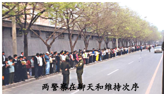
两警察在聊天和维持次序

4月25日当天，上万名闻讯而来法轮功群众没有口号、没有标语，安静有秩序的在北京国务院信访办等候了十几个小时。总理朱镕基接见了学员代表，令天津公安局放人，并重申了国家不会干涉群众炼功的政策。当晚9点多，学员们悄然离去。整个