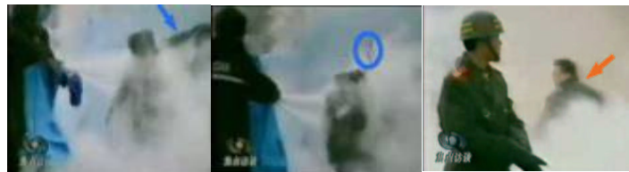
1.刘头部受重击 2.击打后飞出的重物 3.打击者仍保持用力姿势

那么谁是出手打击的人呢？如果把那一时刻镜头止住，可以看见挥动的手臂接近刘春玲的头部，穿着军衣的武警正走向镜头前面，在他身后，一名身穿大衣的男子正好站在出手打击的方位，仍然保持着一秒钟前用力的姿势。