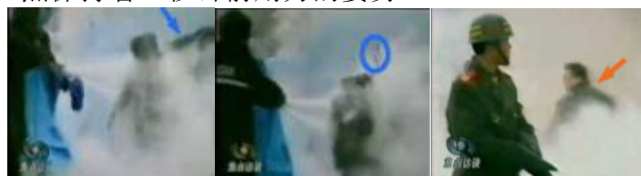
1.刘头部受重击 2.击打后飞出的重物 3.打击者仍保持用力姿势

那么谁是出手打击的人呢？如果把那一时刻镜头止住，可以看见挥动的手臂接近刘春玲的头部，穿着军衣的武警正走向镜头前面，在他身后，一名身穿大衣的男子正好站在出手打击的方位，仍然保持着一秒钟前用力的姿势。