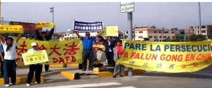
秘鲁法轮功学员在胡锦涛一行 途经之处高举横幅标语

【明慧网】二零零八年十一月下旬，亚太高峰会议在秘鲁举办。中共国家主席胡锦涛十九日对秘鲁进行国事访问。之前，针对中共国家主席胡锦涛的到来，秘鲁法轮功学员向总统递交了法轮功学员在中国大陆受迫害的资料，呼吁秘鲁总统向胡锦涛转达“立即停止迫害法轮功”的呼声。同时，法轮功学员分别接受多家电台采访，向秘鲁各界听众广泛讲述中共极力掩盖的迫害法轮功的真相。节目受到各界民众的关注，人们纷纷打电话到电台询问详情。