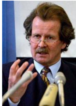
联合国“酷刑问题”特派专员诺瓦克教授曾多次向联合国酷刑委员会提出法轮功学员被活摘器官的指证

反酷刑委员会的建议还包括：中共当局应该立即采取措施禁止全国范围内的酷刑和虐待；中共应该立即废除所有形式的行政拘留，其中包括劳教；中共应当确保没有人被关在任何秘密的拘留中心；中共应该废除所有的禁止律师独立性的法令，并调查所有对律师和原告的攻击；中共应该立即采取措施调查所有恐吓律师进行独立操作的行为；中共应该采取所有可能的措施确保所有的犯人，包括那些人权犯，不会因为他人权范围内的行为而受到任何骚扰和酷刑对待，并确保对这些进行立即、