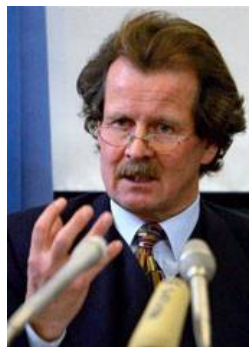
联合国“酷刑问题”特派专员诺瓦克教授曾多次向联合国酷刑委员会提出法轮功学员被活摘器官的指证

反酷刑委员会的建议还包括：中共当局应该立即采取措施禁止全国范围内的酷刑和虐待；中共应该立即废除所有形式的行政拘留，其中包括劳教；中共应当确保没有人被关在任何秘密的拘留中心；中共应该废除所有的禁止律师独立性的法令，并调查所有对律师和原告的攻击；中共应该立即采取措施调查所有恐吓律师进行独立操作的行为；中共应该采取所有可能的措施确保所有的犯人，包括那些人权犯，不会因为他人权范围内的行为而受到任何骚扰和酷刑对待，并确保对这些进行立即、