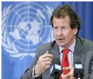
联合国特派专员 弗瑞德·诺瓦克

狱、劳教所、精神病院、秘密拘留中心等处广泛存在性虐待、酷刑、用精神药物迫害法轮功学员、人权律师等。