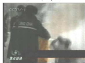
3、手摸被打后的头部