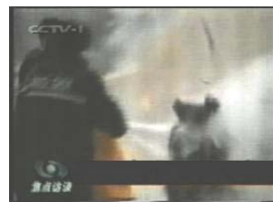
2、击打后飞出的重物