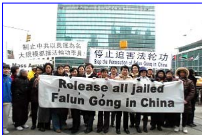
3月18日部份法轮功学员及支持者在联合国总部门前向各国驻联合国代表团呼吁制止中共迫害法轮功

「全球百万签名反迫害」于二零零八年一月起在香港启动，获得全球一百三十三国一百三十五万多人的连署支持，各国政要对于本国公民反