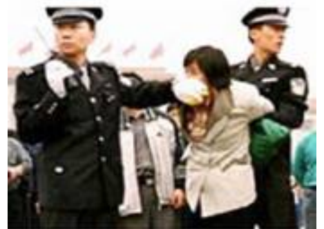
人们说真话的权利也被剥夺

然而中共为了制造一言堂的舆论，迫害一开始就大量销毁法轮功的书籍，封锁互联网的信息，让人们无法了解事实。