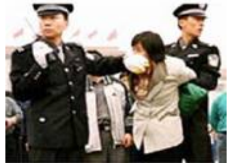
人们说真话的权利也被剥夺

然而中共为了制造一言堂的舆论，迫害一开始就大量销毁法轮功的书籍，封锁互联网的信息，让人们无法了解事实。