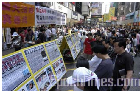
▲香港法轮功学员的真相点

由于行程安排得比较紧，第一个景点是香港的太平山，在这里可以俯视全香港夜景。车子开到太平山时，已接近傍晚，景点集满了来自四面八方的游客，尽管这样，我还是第一眼就看到了