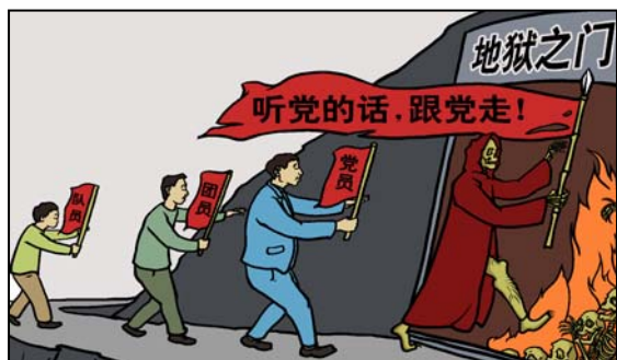
漫画：听党话 跟党走