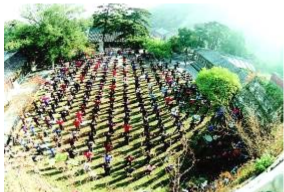
一九九七年法轮功学员在北京戒台寺集体炼功