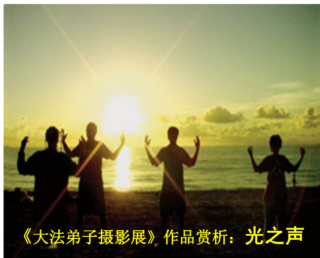
《大法弟子摄影展》作品赏析: 光之声