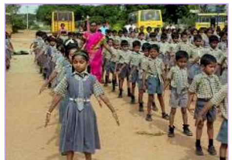
右图：学校学生集体炼法轮功