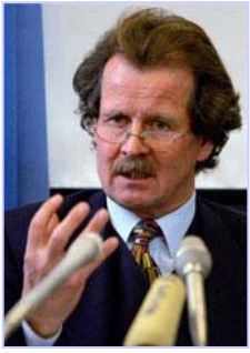
联合国酷刑问题专员诺瓦克多次向联合国酷刑委员会提出法轮功学员被活摘器官的指证

十一月七日，联合国反酷刑委员会的专家对中国执行《禁止酷刑公约》的情况进行质询。在发现作为缔约国的中国未能履行公约中的条款后，反酷刑委员会十一月二十一日命令中共对法轮功学员器官被活摘的指控和对这场对法轮功迫害的责任人进行调查。