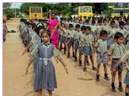
右图：学校学生集体炼法轮功