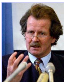
联合国酷刑问题专员诺瓦克多次向联合国酷刑委员会提出法轮功学员被活摘器官的指证

据英文大纪元报导，这是全世界最大的国际组织近几年来第一次直接命令中共政权对其大范围的迫害人权负责。十一月七日，联合国反酷刑委员会的专家对中国执行《禁止酷刑公约》的情况进行质询。在发现作为缔约国的中国未能履行